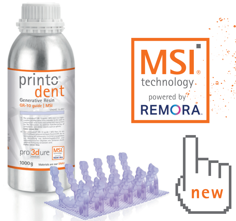
Abb. 1: printo dent ® 3D-Druckharze mit MSI ® Technologie. Fig. 1: printo dent ® 3D printing resins with MSI ® technology.

The formation of biofilms is therefore a significant medical problem (e. g. caries formation). If the communication of microbes could now be interfered with by means of suitable molecules, bacterial infections could also be contained. Unlike antibiotics, the germs would not be killed, but cut off from their information channels. For this reason, the organisms cannot develop resistance to the interfering molecules, as is known from antibiotic resistance. (Fig. 2) In nature, biofilms are not observed on all moist surfaces. There are species of algae that are virtually free of biofilms. For example, the red alga Delisea produces a variety of natural compounds (furanones) that appear to block quorum sensing by bacteria. Inspired by nature, Unilever / Penrhos Bio has developed a biomimetic technology based on these natural compounds to combat biofilms (called Remora™ ). Research results also document that the bacteriostatic effect works not only on bacteria but also on yeasts, fungi and algae. Thus, a technology is available that can effectively combat „multi-species“ biofilms.