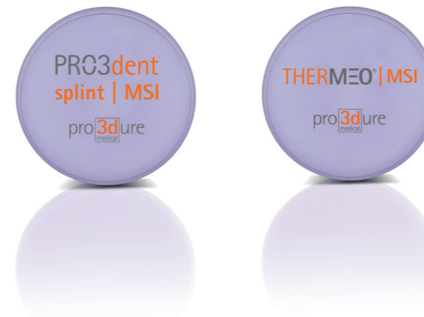
Abb. 3: PRO3dent ® und THERMEO ® Ronden mit MSI ® Technologie. Fig. 3: PRO3dent ® and THERMEO ® blanks with MSI ® technology.